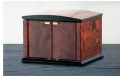
elmamotion corona 2 Version Wurzelholz Uhrenbeweger für 2 Uhren