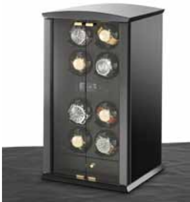
elmamotion corona 8 Version piano / Glastüren Uhrenbeweger für 8 Uhren und Schublade für 3 Uhren