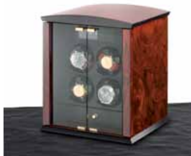
elmamotion corona 4 Version Wurzelholz / Glastüren Uhrenbeweger für 4 Uhren und Schublade für 3 Uhren