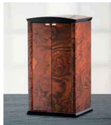
elmamotion corona 8 Version Wurzelholz Uhrenbeweger für 8 Uhren und Schublade für 3 Uhren