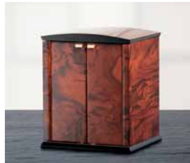
elmamotion corona 4 Version Wurzelholz Uhrenbeweger für 4 Uhren und Schublade für 3 Uhren