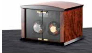
elmamotion corona 2 Version Wurzelholz / Glastüren Uhrenbeweger für 2 Uhren