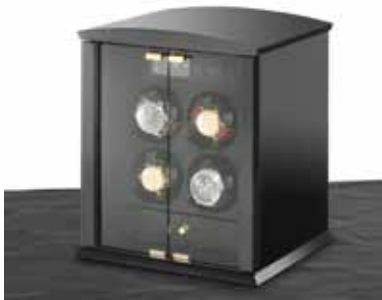
elmamotion corona 4 Version piano / Glastüren Uhrenbeweger für 4 Uhren und Schublade für 3 Uhren