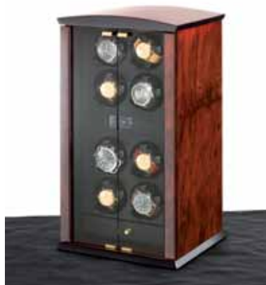
elmamotion corona 8 Version Wurzelholz / Glastüren Uhrenbeweger für 8 Uhren und Schublade für 3 Uhren