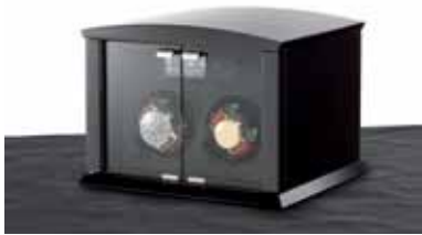
elmamotion corona 2 Version piano Uhrenbeweger für 2 Uhren